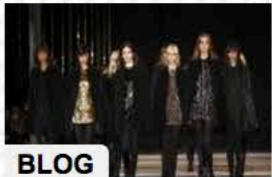
BLOG Laurence Benaïm