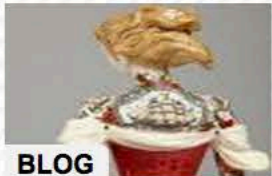
BLOG Karine Porret